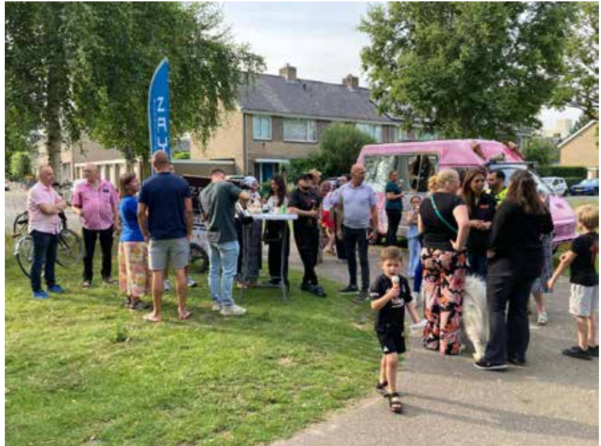
'FF Buurten'. Op 17 juni kwamen beroepskrachten van verschillende partijen praten over wat er leeft en speelt in de wijk, onder het genot van lekkere ijsjes!

Het is zó leuk om in deze wijk mee te mogen doen. Als ik mensen vraag: 'Hoe is het leven hier in De Kruiskamp of Schutskamp?' Dan hoor ik meestal: 'O, prima hoor! Lekker veel ruimte, dicht bij de stad, de Helftheuvel om de hoek. Voldoende groene plekken, zoals 't Beatrixpark om in te chillen en het lekkere water van het Engelermeer vlakbij voor een duik in de zomer. Vrienden en familie die in de buurt wonen.' Natuurlijk hoor ik ook wel eens wat gemopper, dat hoort er bij als je voor team gemeente speelt. Bijvoorbeeld op de avond van 17 juni. Toen waren we met een groep beroepskrachten op verschillende plekken in de wijk in gesprek met buurtgenoten over wat er leeft en speelt. Klachten gaan vooral over het hard rijdende verkeer, of het gebrek aan parkeerplaatsen in sommige straten. De meeste mensen zijn gelukkig vooral tevreden met wonen hier. Super fijn!