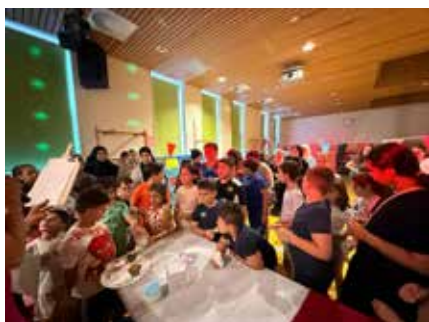
afsluiting van Klup-up

In de BBS is vrijdag 20 juni groots feest gevierd. Bij de afsluiting van Klup-up werden de kinderen uitgedaagd te laten zien wat ze hebben bereikt. Klup-up organiseert buitenschoolse activiteiten voor kinderen in de basisschoolleeftijd. Elk seizoen van een aantal weken valt er door kinderen te kiezen. Sportieve, creatieve en skills verhogende activiteiten worden aangeboden door professionals en passievolle leraren. Skeelers, LEGOrobot bouwen, koken en tekenen/schilderen behoorden tot de keuzeactiviteiten. Kinderen die niet deelgenomen hebben waren ook welkom de creaties te bewonderen of de sporten te proberen. De jongens en meiden van Klup-up mogen echt trots zijn op hun prestaties afgelopen weken.