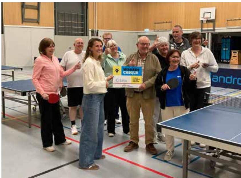
TafelTennisVereniging de Kruiskamp '81 kreeg een cheque

TTV De Kruiskamp '81 ontvangt bijdrage uit Bosch Sportakkoord