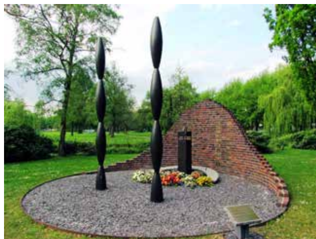
Het Indiëmonument aan de Zuiderparkweg

Donatie wordt erg op prijs gesteld. We hopen u te zien op zaterdag 30 augustus.