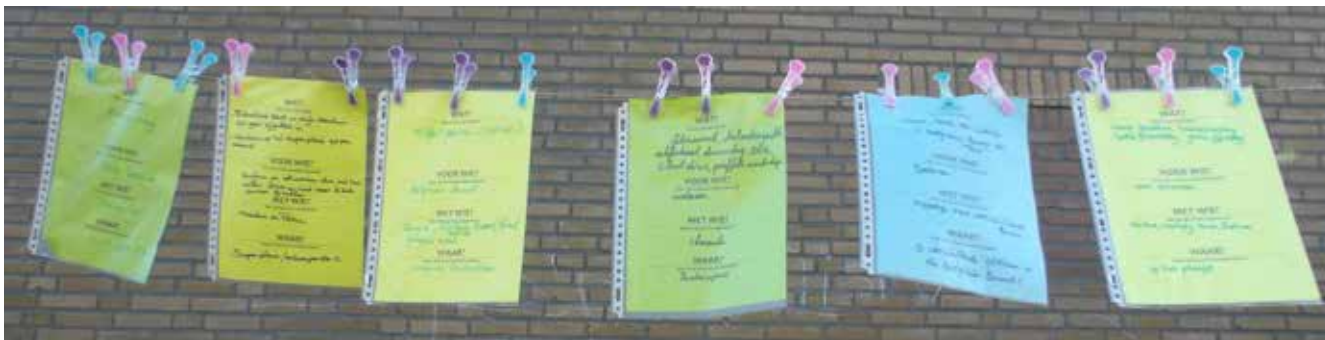
ideeën, netjes aan de waslijn...

Het was een mooie zomerse avond op donderdag 17 juli. Mij was gevraagd om in de Belgische buurt te gaan kijken bij een evenement dat werd georganiseerd door het opbouwwerk van Farent samen met Zayaz, Brabant Wonen en Samen Gezond van de gemeente. De Belgische buurt is een deel van Kruiskamp waar ik regelmatig langs fiets, maar ik was er nog nooit gaan kijken en deze zomeravond was een goed