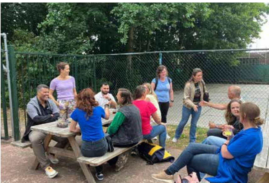
Beroepskrachten na afloop van leefbaarheidsoverleg, werken aan korte lijstjes