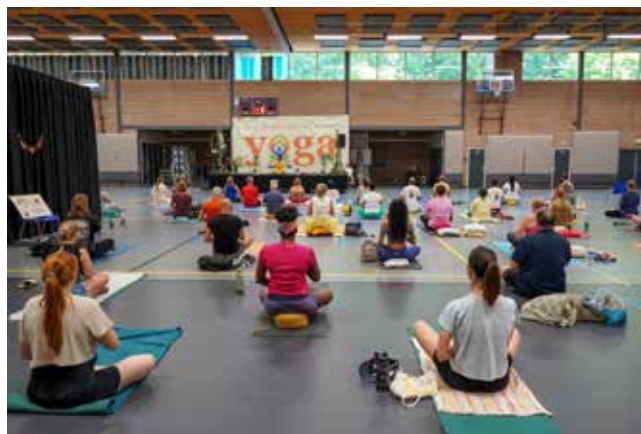
Aan de yogadag deden ongeveer 80 mensen mee

Yoga leer je niet uit een boekje. Er zijn dan ook opleidingen om yogaleraar te worden. 'Ik heb mijn diploma in 2020 behaald. Sinds die tijd geef ik ook trainingen. Zelf doe ik voor een sessie oefeningen thuis om alvast rustig te worden en in balans te zijn, je kan nu eenmaal niet schenken uit een beker die leeg is. Als je nog onervaren bent kun je het best in kleine groepen de technieken leren. Ik gaf eerst online lessen vanwege corona, maar nu doe ik het ook