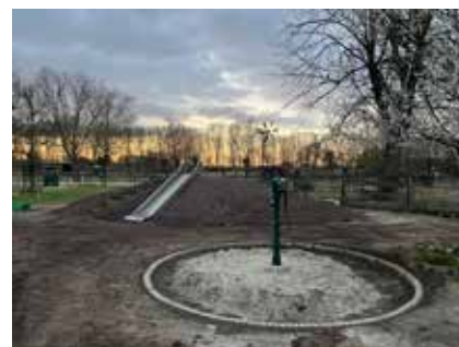
de nieuwe speeltuin