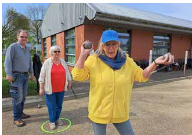
Het is altijd feest bij het jeu de boules

Op zaterdag 23 augustus en zaterdag 13 september organiseert Pétanque Union Bois le Duc weer een open jeu de boules-toernooi, genaamd de 'Bossche bollenmix'.