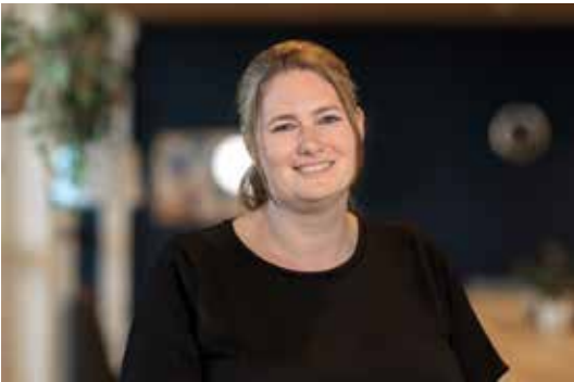
Deva - KC Westerbreedte

Zij zijn veel op de scholen en op het schoolplein aanwezig en leggen zo - laagdrempelig - contact met de ouders. Bij zowel KC Westerbreedte als BS Nour is een weggeefkast met verzorgingsproducten die gratis meegenomen mogen worden. Ook zijn beide scholen een Menstruatie Uitgifte Punt (MUP), waar gratis producten aanwezig zijn indien dit nodig is voor de kinderen en ouders.